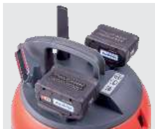
Batterie, pulsanti di controllo e accessori standard