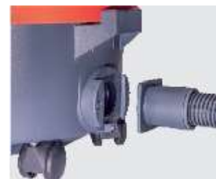
Robusto collegamento scorrevole