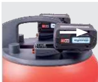
Facile montaggio/smontaggi o delle batterie