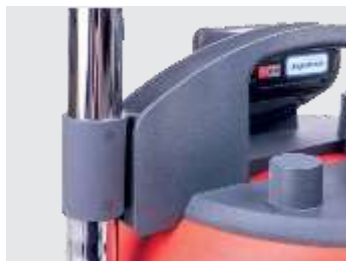
Supporto per il tubo di aspirazione