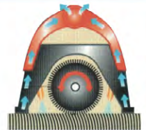
Sprühen, bürsten und saugen vorwärts und rückwärts